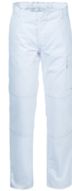
02 - BIANCO