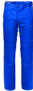
06 - AZZURRO ROYAL