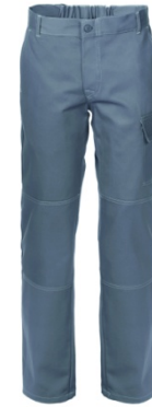
12 - GRIGIO