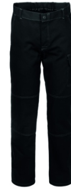
05 - NERO