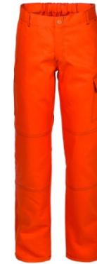
09 - ARANCIO