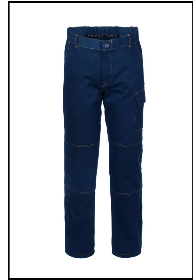
01 - BLU