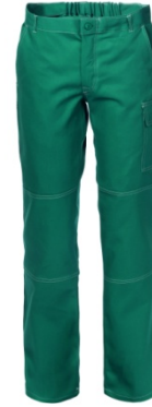
04 - VERDE