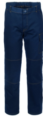
01 - BLU