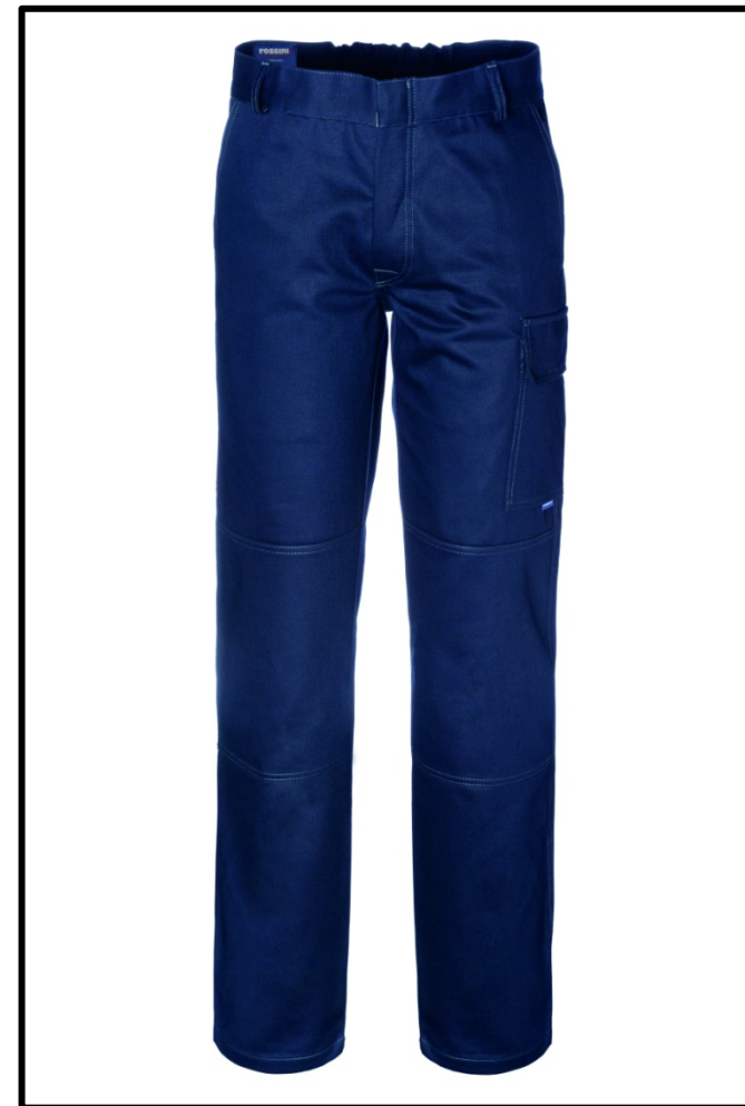
01 - BLU