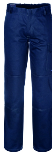
01 - BLU