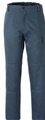
12 - GRIGIO