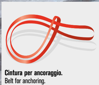
Cintura per ancoraggio. Belt for anchoring.

50.000 resistance/cycles EN 131-2: 2017 USO PROFESSIONALE PROFESSIONAL USE