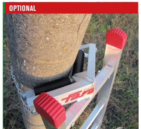
Poggiapalo cod. P8. Pole support cod. P8.