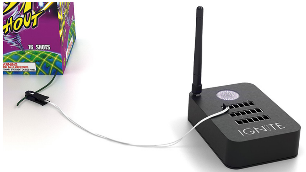
Pata kytkettynä sytytysmoduuliin. Vakiosytyttimen mitta on kaksi metriä, mutta myös pidempiä on saatavilla.

esiohjelmoinnin mukaisesti. Show Designerissa voit myös ladata harrastajien tekemät ilotulitekirjastot Suomessa myytävistä tuotteista ja voit lisätä nämä näytökseesi. Voit myös jakaa rakentamasi näytöksen muiden kesken halutessasi. Lisäksi voit ladata oman ilotulitekirjastosi ohjelmaan ja suunnitella näytöksesi sen mukaan.