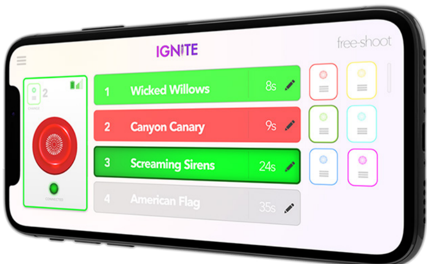
Igniten käyttöön tarvittavan ohjelman englanninkielinen näyttö. Kuvassa vapaa-ammuntamoodi eli tuotteita ammutaan yksittäin valitsemalla. Ohjelman Suomenkielinen versio tulee saataville alkuvuodesta 2022.

Ignite on kokonaisuutena erittäin tervetullut lisä Suomen ilotuliterintamalle. Se muuttaa täysin kuluttajien ilotulituskokemuksen, kun myös tavallinen talaja voi suunnitella kuluttajatuotteilla rakennetun näytöksensä hienoksi kokonaisuudeksi. Ignite on pitkä harppaus kohti turvallisempaa ja taiteellisempaa tavallisen kuluttajan ilotulituskokemusta. Lyhyesti kiteytettynä, Ignite tekee ilotulitteiden ammunasta hauskempaa, nautinnollisempaa ja turvallisempaa.