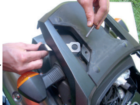
Ensamble de platina 6 Con tornillo original de la parrilla

1- Primero fijar a la moto las platinas 2 - 4 - 6 y 7, teniendo en cuenta la marcación derecha e izquierda .