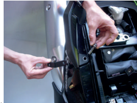
Ensamble de platina 4 Con tornillo original debajo del sillín