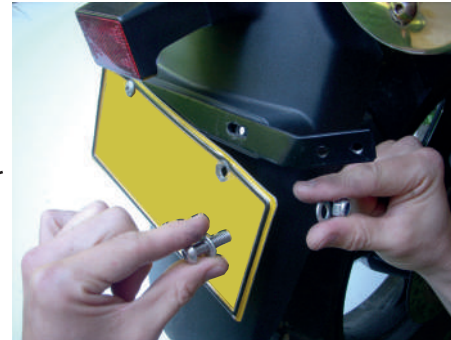
Ensamble de platina placa (7) Con tornillos suministrados (D), arandelas (A), tuercas (C)