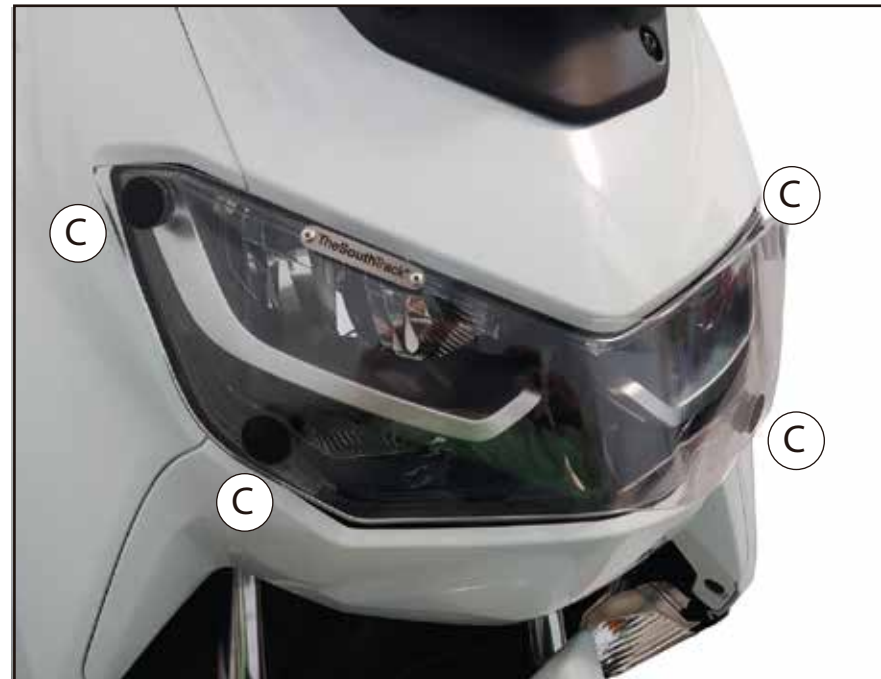
Imagen no. 1