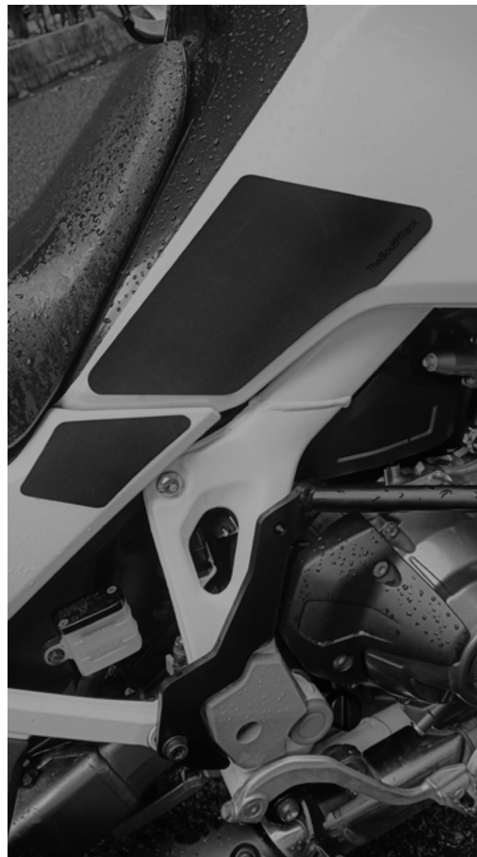
Foto ilustrativa lado derecho