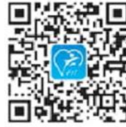
QR-code FFit (iOS)