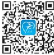
QR-code FFit (Android)

Swipe omlaag op interface, druk om QR-code te tonen en scannen met mobiele telefoon om de app te downloaden.