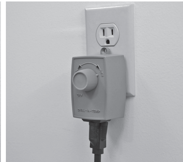
3. Fiche connectée régulateur de vitesse sur prise de courant.