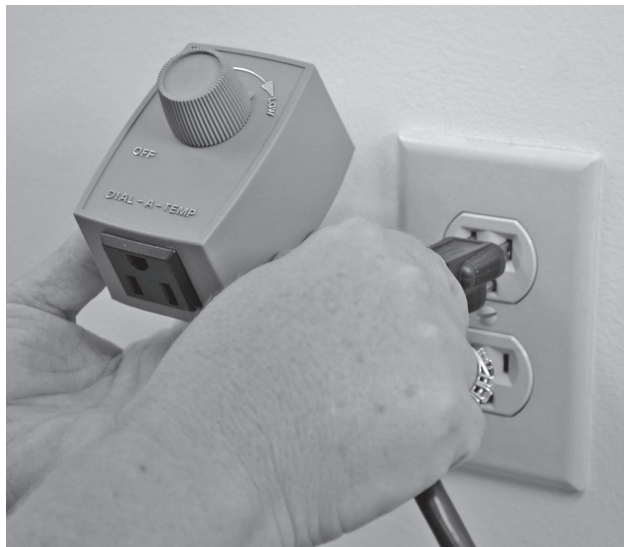
1. Débranchez le cordon du mur prise de courant.