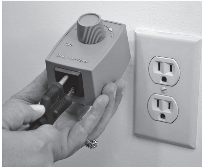
2. Plug in fan cord into receptacle on bottom of plug-in speed controller.