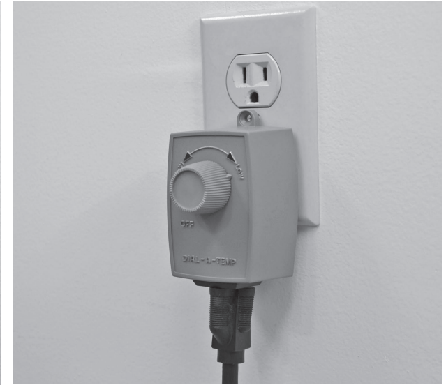
3. Plug connected speed controller into wall socket.