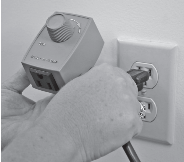
1. Un-plug cord from wall receptacle.