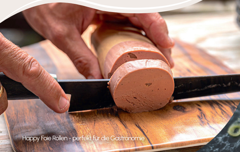
Happy Foie Rollen - perfekt für die Gastronomie

Unsere Bio-Gänseleber stammt von einem kleinen, familienbetriebenen Bio-Bauernhof in Fulda. Die Gänsezucht wird vollständig nach den Richtlinien der ökologischen Landwirtschaft betrieben - unter anderem bedeutet das: Artgerechte Tierhaltung mit ausreichend Wasserflächen, ausschließlich Bio-Futter und der garantierte Verzicht auf Antibiotika als Wachstumsförderer.