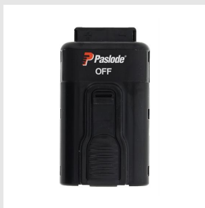
Codice 018880 Batteria IM Li