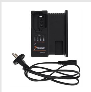
Codice 018881 Carica batteria IM Li