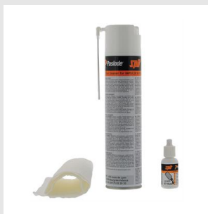
Codice 013690 Kit pulizia Impulse-Spit