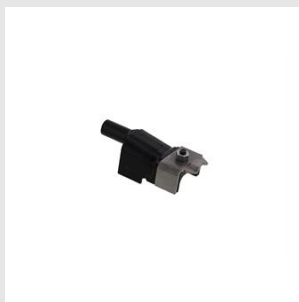
Codice 019785 Tastatore anti-impronta IM90Xi per fermategola