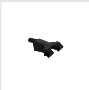
Codice 019784 Tastatore anti-impronta IM90Xi per parquet