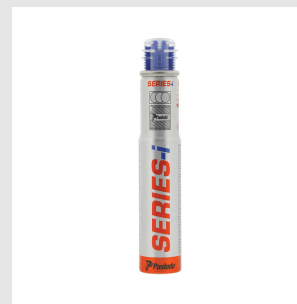
Codice 300348 Blister bombolette gas IM90I (1 pz)