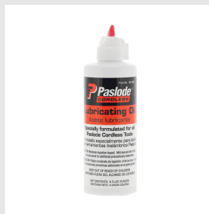
Codice 401482 Lubrificante Impulse