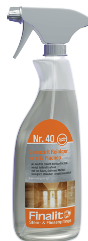
0,5L Sprühflasche (anwendungsfertig)