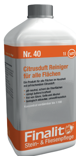
0,25L, 1L, 5L oder 20L (Konzentrat)