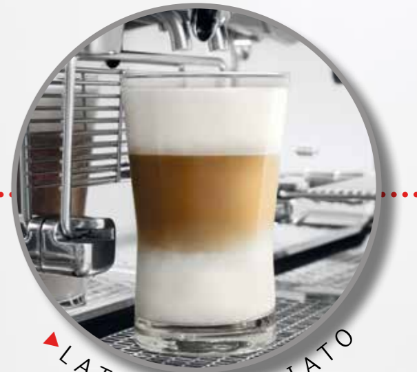
▶ LATTE MACCHIATO