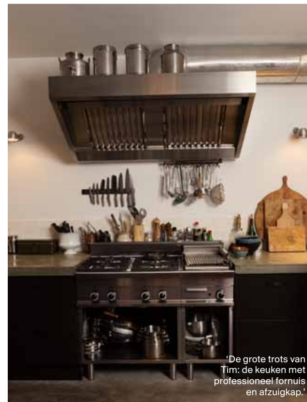
‘De grote trots van Tim: de keuken met professioneel fornuis en afzuigkap.’

Opvallend in het interieur zijn de natuurinten: aubergine, taupe, beige. →