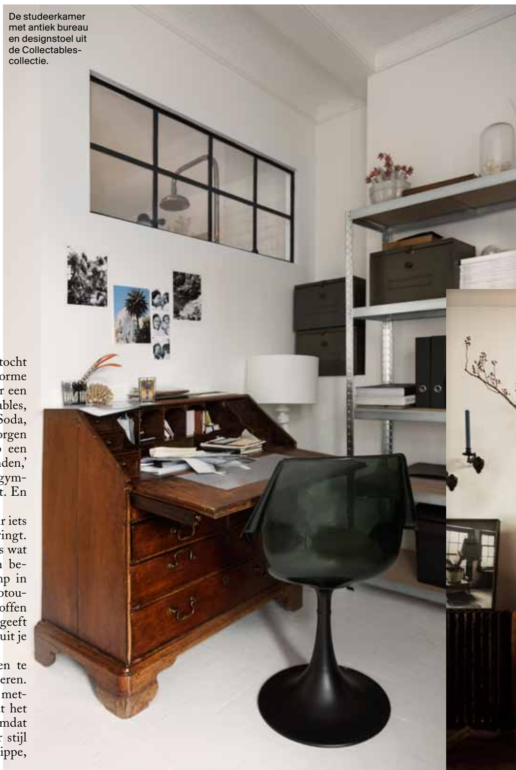
De studeerkamer met antiek bureau en designstoel uit de Collectables-collectie.