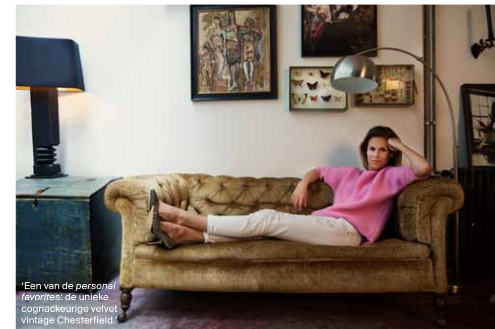
‘Een van de personal favorites: de unieke cognackeurige velvet vintage Chesterfield.’