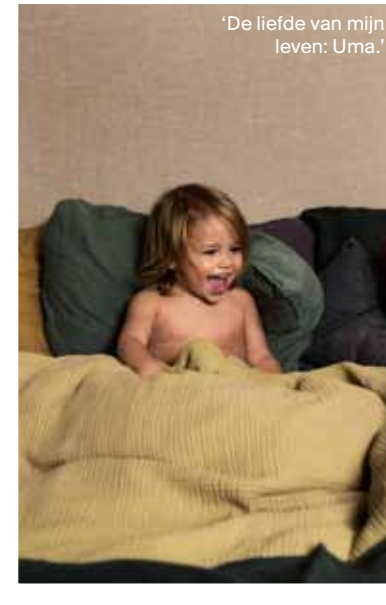
‘De liefde van mijn leven: Uma.’