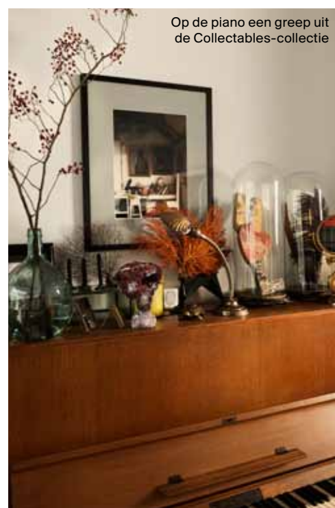
Op de piano een greep uit de Collectables-collectie