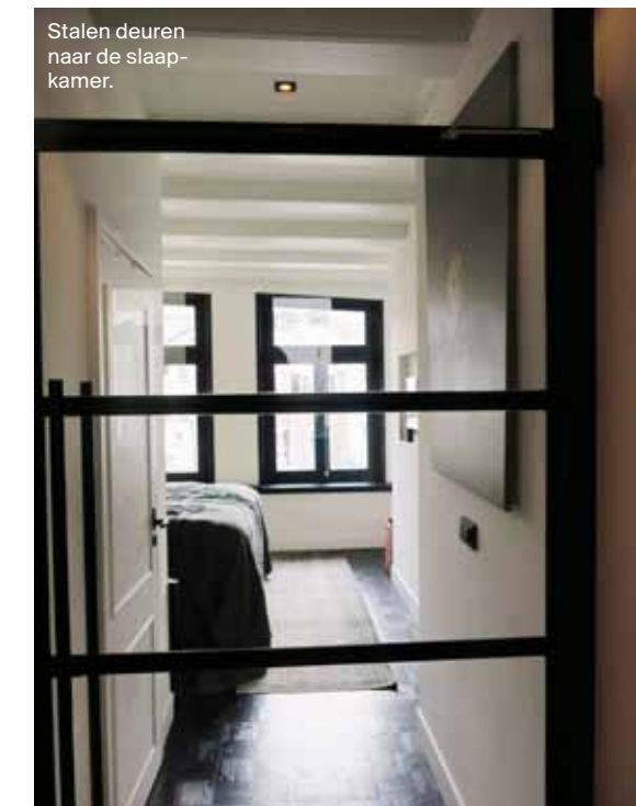
Stalen deuren naar de slaapkamer.