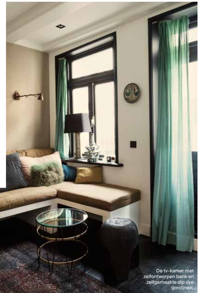
De tv-kamer met zelfontworpen bank en zelfgemaakte dip dye gordijnen.