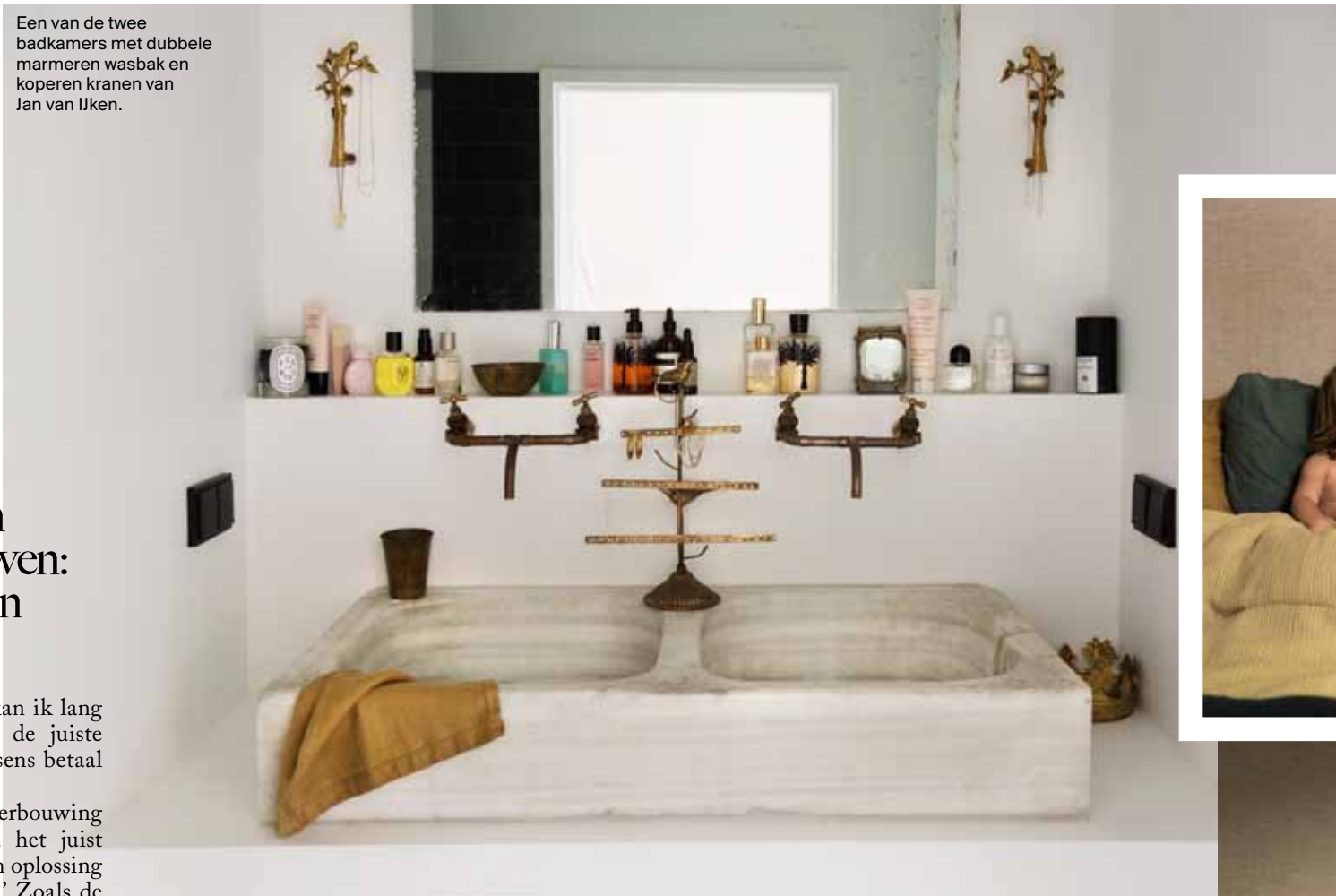
Een van de twee badkamers met dubbele marmeren wasbak en koperen kranen van Jan van IJken.