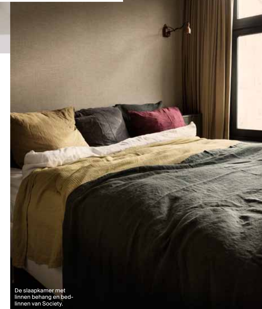
De slaapkamer met linnen behang en bedlinnen van Society.