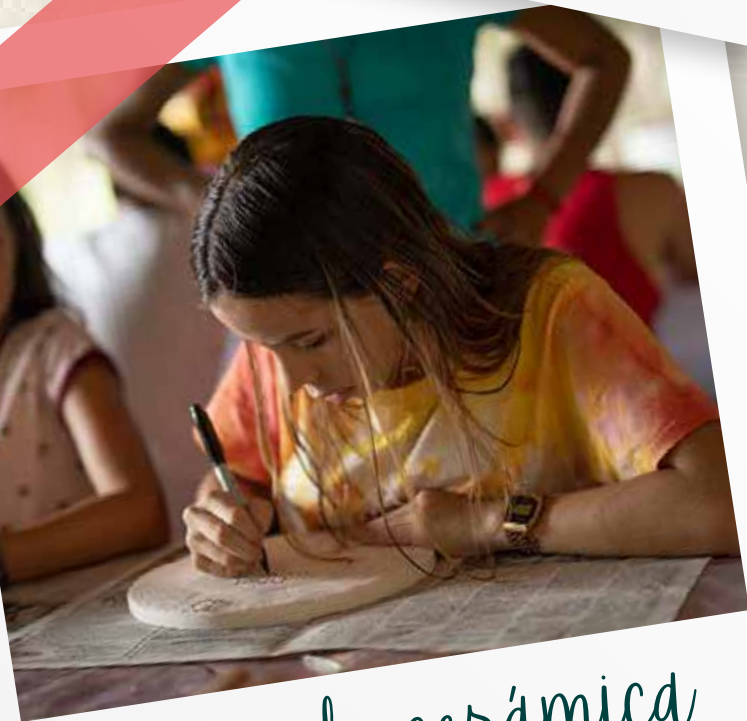
pintura de cerámica