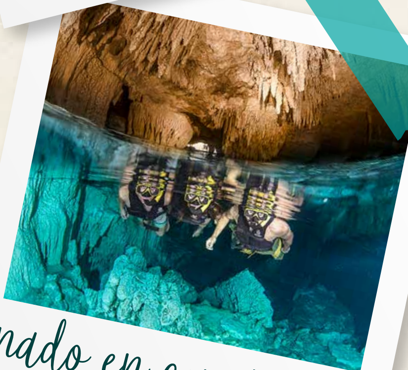
nado en cenote