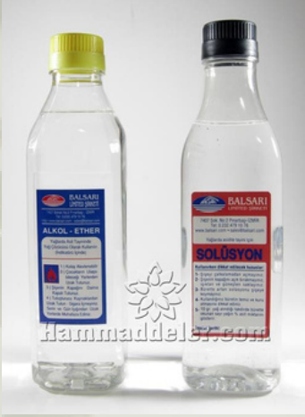
Zeytinyağı Asitlik Tayini Setleri