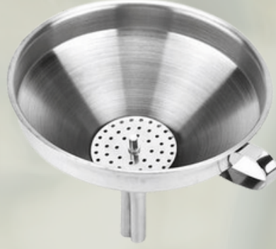
Çelik Süzgeçli Paslanmaz Huniler