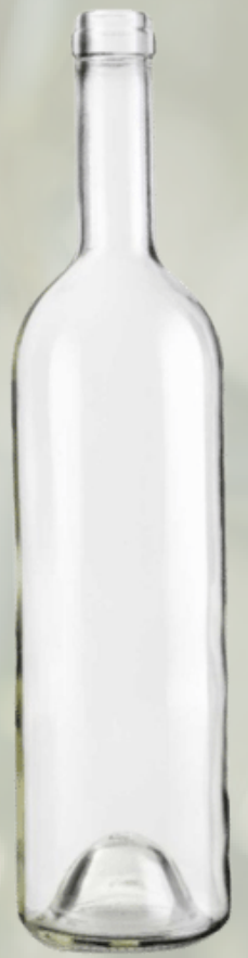
Şeffaf Cam Şişeler