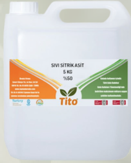
Sıvı Sitrik Asit