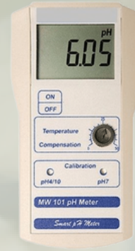
Milwaukee Portatif Tip pH Metreler