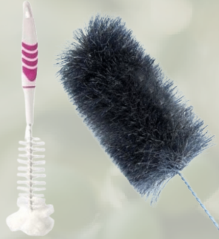
Şişe-damacana temizleme firçaları