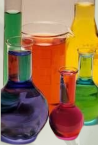
Zeytinyağı Asitlik Tayin Çözeltileri