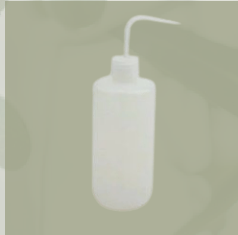
Plastik Piset Damlatma Şişesi