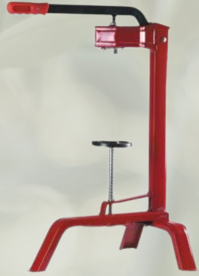
Yer Tipi Mantarlama Makinesi Mantar Kapama Montaj Aletleri