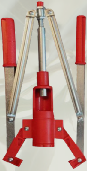
El Tipi Mantarlama Makineler