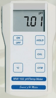
Milwaukee Portatif Tip Gıda Ürünleri İçin pH Metre ve Sıcaklık Ölçerler