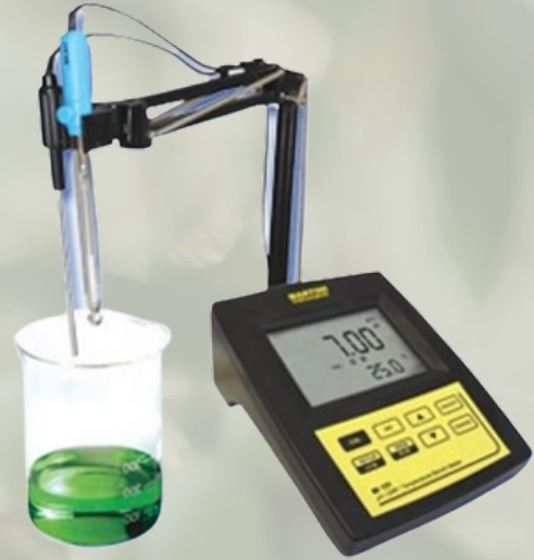
Milwaukee Masaüstü Tipi pH Metre Orp Metre ve Sıcaklık Ölçerler