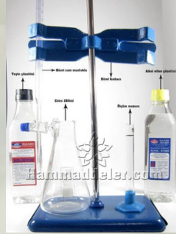
Zeytinyağı Asitlik Tayini Setleri (Başlangıç Seti)