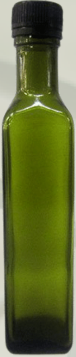
Marasca Zeytinyağı Şişeler