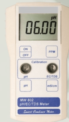
Milwaukee Portatif Tip pH Metre, İletkenlik ve TDS Ölçerler