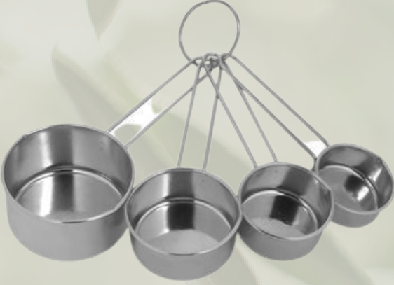
Paslanmaz Çelik ölçü kaşıkları