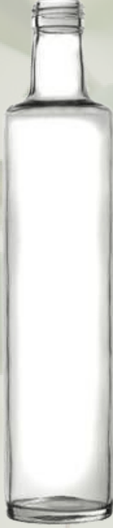
Dorica Şeffaf Cam Şişeler