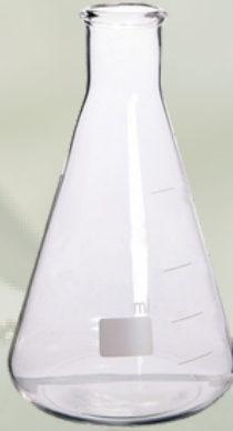
Erlen Dar Boyunlu Dereceli Erlenmayerler