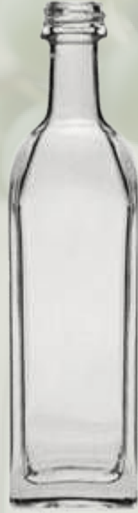
Marasca Şeffaf Cam Şişeler