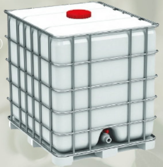
Sıvı Laktik Asit %80lik E270 Ibc 1200 kg