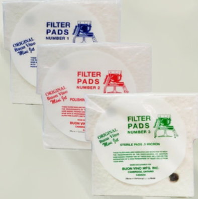
Minijet Filtre için Yedek İnce Filtre Kağıdılar