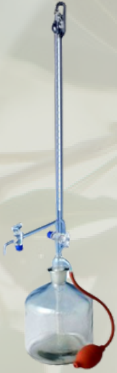
Otomatik Cam Musluklu Şeffaf büretler