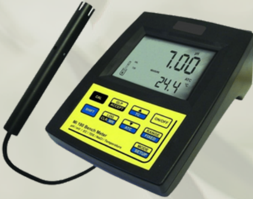
Milwaukee Masaüstü Tip pH Metre Orp Metre, İletkenlik, TDS, Sodyum Klorür (NaCl) ve Sıcaklık Ölçerler