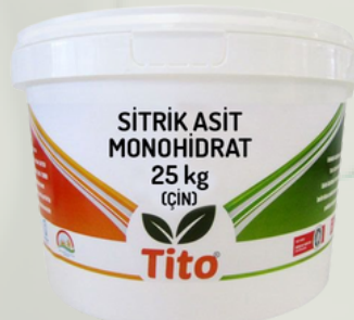
Sitrik Asit Anhidrat