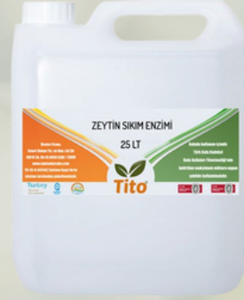
Zeytin Sıkım Enzimi