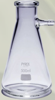
Nuche Nuçe Erlen Erlenmayerler