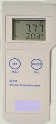
Milwaukee Portatif Tip pH Metre Orp Metre ve Sıcaklık Ölçerler