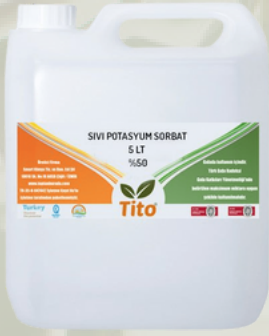
Sıvı Sodyum Benzoat