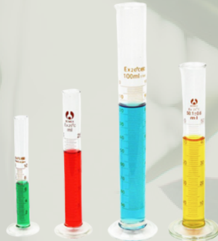
Uzun Form Cam Mezüralar