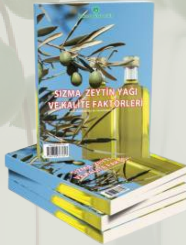
Sızma Zeytin Yağı ve Kalite Faktörleri Kitapları