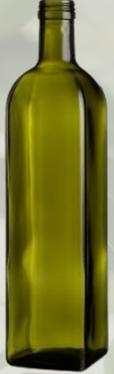
Marasca Yeşil Cam Şişeler