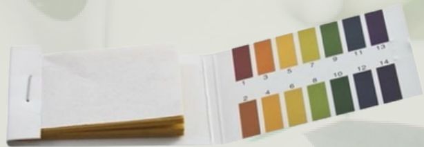
Merck pH Kağıtları