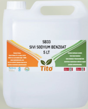
Sıvı Potasyum Sorbat