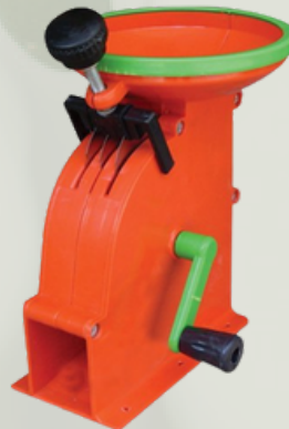
Zeytin Çizme Makinesi