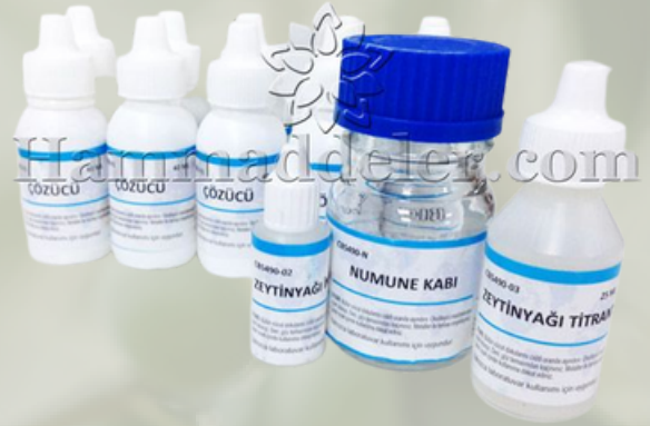
Zeytinyağı Asitlik Test Kitleri