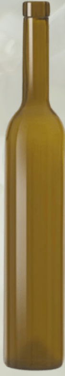
Futura Fascetta Koyu Yeşil Cam Şişeler