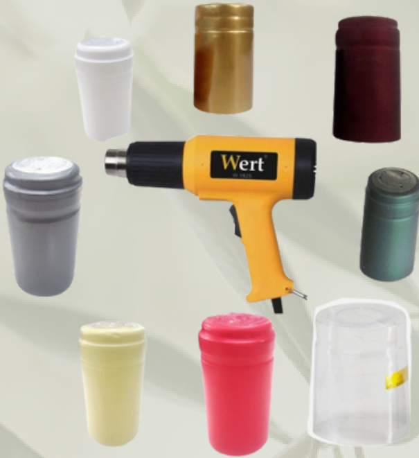
Kapşonlar ve Kapşonlama Setler