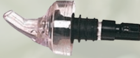
Mantar Tıpalı Metal Şişe Dökücüler