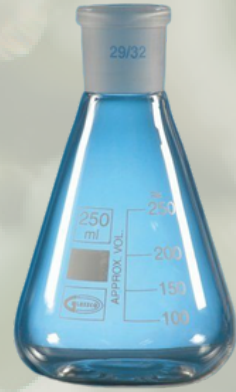
Şilifli Erlen Erlenmayer