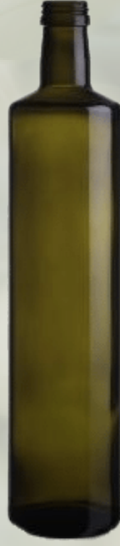
Dorica Yeşil Cam Şişeler