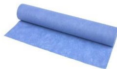
ROLLO PARA MESA DE EXPLORACION