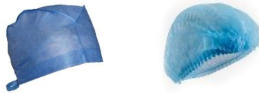
GORRO PARACIRUJANO GORRO PARA PACIENTE GORRO PARA PACIENTE CAL. 17