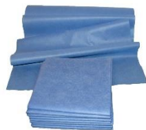
SABANA DE 90x110cms SABANA DE 90x180cms SABANA DE 140x250c