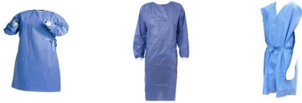
BATA PARA CIRUJANO CON PUÑO DE ALGODÓN BATA PARA PACIENTE CON MANGA CORTA BATA PARA PACIENTE MANGA LARGA BATA PARA PACIENTE SIN MANGA