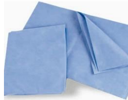
FUNDA PARA ALMOHADA