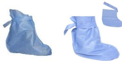
BOTA CON PLANTILLA BOTA SIN PLANTILLA