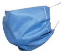
CUBREBOCA DESECHABLE AZUL o BLANCO