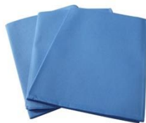
CAMPO CLINICO DE 90x90cms