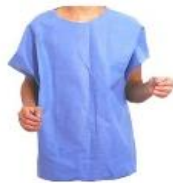
CAMISA PARA CIRUJANO