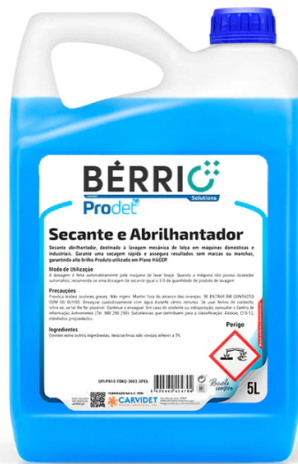
IMAGEM DE PRODUTO