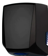
Acabado Negro Mate