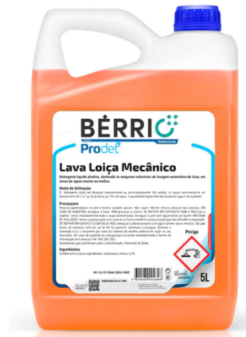
IMAGEM DE PRODUTO