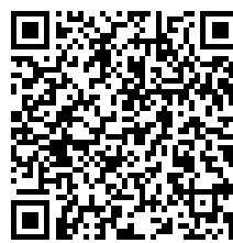
Ficha de Segurança