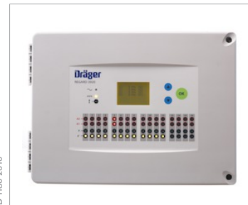
Dräger REGARD® 3910