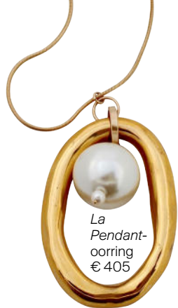
La Pendant- oorring € 405