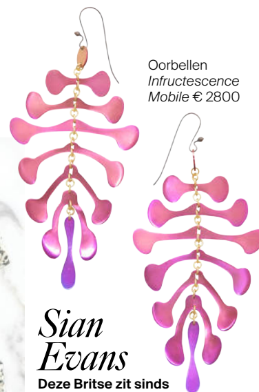
Oorbellen Infructescence Mobile € 2800