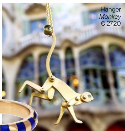
Hanger Monkey € 2720