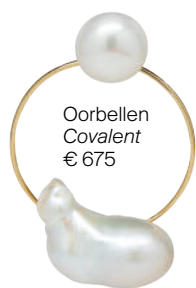
Oorbellen Covalent € 675

Sonia Boyajian Kleurrijk, opvallend en robuust; nobody puts baby in a corner.