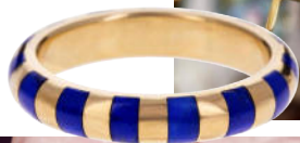
Lapis Sienna- ring € 2100