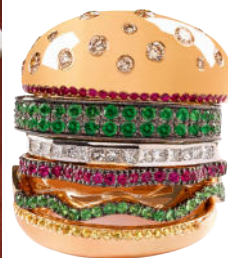
Veggie Burger- ring bestaande uit zes losse ringen, samen € 7000

Alles van sushi, tem-pura en edamame tot hamburgers. Humor in de meest edele materialen.