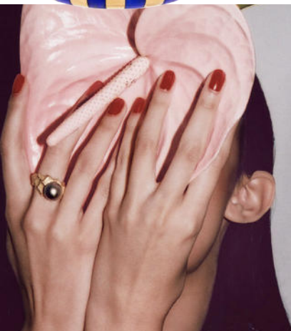
Wave-ring met tahitiparel, p.o.a.