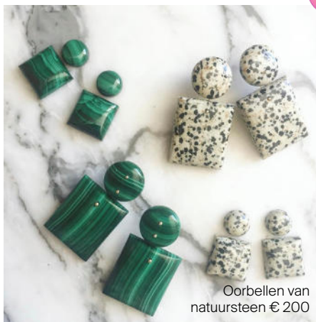
Oorbellen van natuursteen € 200