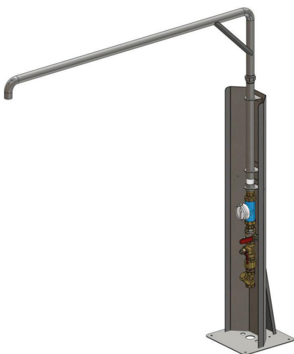
Potence fixe. Hauteur: 2.5 m - déport : 2.3 m