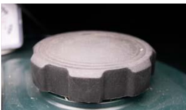
Bouchon de remplissage 3"

Le bouchon de remplissage permet à votre fournisseur de fioul de remplir facilement la citerne.