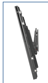
+15°/-5° Neigung für vielseitige Blickwinkel