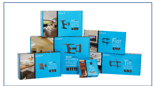
Wird in einer Farbverpackung mit mitgelieferter Installationshardware und einfach zu befolgenden Anweisungen geliefert.