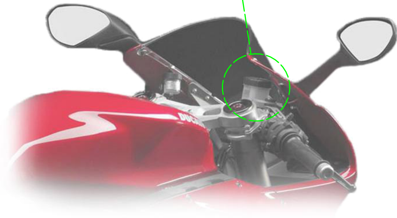
Immagine usata a fini esclusivamente illustrativi Image used for illustrative purposes only