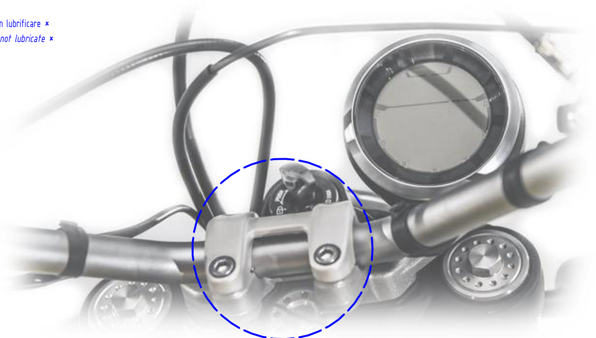
Immagine usata a fini esclusivamente illustrativi Image used for illustrative purposes only

Lubrificare ✓ / Non lubrificare ✗ Lubricate ✓ / Do not lubricate ✗