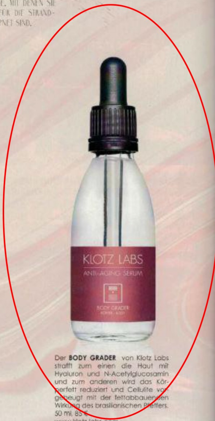
Der BODY GRADER von Klotz Labs strafft zum einen die Haut mit Hyaluron und N-Acetylglucosamin und zum anderen wird das Körperfett reduziert und Cellulite vorgebeugt mit der fettabbauenden Wirkung des brasilianischen Pfeffers. 50 ml, 85 € www.klotz-labs.com

Medizinisch ist dies völlig unbedenklich: Es befinden sich nämlich nur etwa zwei Prozent unserer Schweißdrüsen in den Achselhöhlen, die Selbstkühlung des Körpers funktioniert auch ohne sie. Der Preis für die Behandlung liegt bei etwa 1.900 €. Frau Dr. Moers-Carpí aus München ist eine der führenden Ärztinnen, die diese miraDry® -Methode in Deutschland anbietet. www.hautfok.de