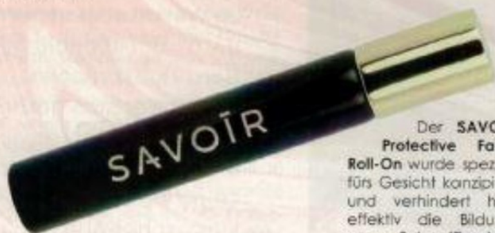
Der SAVOÏR Protective Face Roll-On wurde speziell fürs Gesicht konzipiert und verhindert hier effektiv die Bildung von Schweißperlen. 15 ml, 24,90 € www.sa-voïr.de