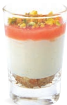
CHEESECAKE CITRON SABLÉ - GOYAVE

LEMON CHEESECAKE COOKIE CRUMBLE - GUAVA 701136810224