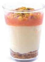
CHEESECAKE CITRON SABLÉ - GOYAVE

LEMON CHEESECAKE COOKIE CRUMBLE - GUAVA 703136810220