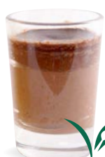
GANACHE CHOCOLAT - CHOCOLAT

CHOCOLATE GANACHE - CHOCOLATE 701138910224