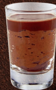
MOUSSE CHOCOLAT NOIR VALRHONA MANJARI 64%

DARK CHOCOLATE MOUSSE VALRHONA MANJARI 64% 701137810224