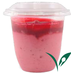
FRAMBOISE - COULIS DE FRAMBOISE

RASPBERRY - RASPBERRY COULIS 727143410215