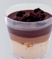
CHOCOLAT NOIR PRALINÉ