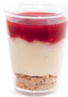
CHEESECAKE À LA FRAMBOISE

CHEESECAKE WITH RASPBERRIES 703124610220