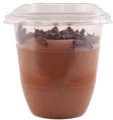
CHOCOLAT - CARAMEL AU BEURRE SALÉ