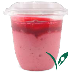
FRAMBOISE - COULIS DE FRAMBOISE