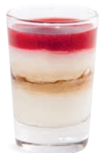
FROMAGE BLANC - MIEL NOIX - FRAMBOISE

FROMAGE FRAIS - HONEY NUTS - RASPBERRIES 701118410224