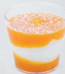
CRÉMEUX COCO COULIS DE MANGUE