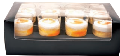
8-PACK PASSION - MERINGUE

8-PACK PASSION FRUIT - MERINGUE 711107110608