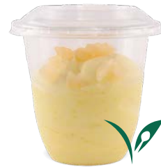
CITRON - ÉCORSE DE CITRON*

RASPBERRY - RASPBERRY COULIS 727143410215