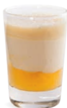
CHEESECAKE - ANANAS CHOCOLAT BLANC

FROMAGE FRAIS - HONEY NUTS - RASPBERRIES 701118410224