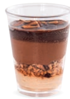
CHOCOLAT NOIR - PRALINÉ GANACHE

DARK CHOCOLATE - PRALINÉ GANACHE 703107310220