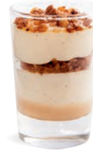
CRÉMEUX VANILLE CARAMEL SALÉ

VANILLA CREAM SALTED CARAMEL 701118210224