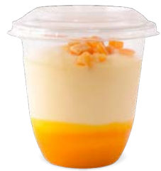
MANGUE - PASSION