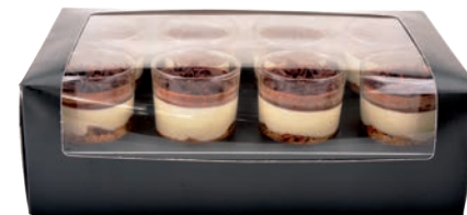
8-PACK CHOCOLAT NOIR/CHOCOLAT BLANC - GANACHE

8-PACK PASSION FRUIT - MERINGUE 711107110608