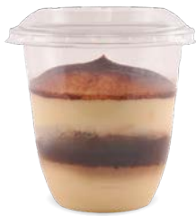
TIRAMISU - CAFÉ