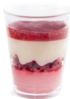
CHOCOLAT BLANC FRAMBOISE

DARK CHOCOLATE DULCE DE LECHE - GANACHE 703136910220