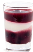
FROMAGE BLANC FRUITS DES BOIS

DARK CHOCOLATE WHITE CHOCOLATE - GANACHE 701118510224