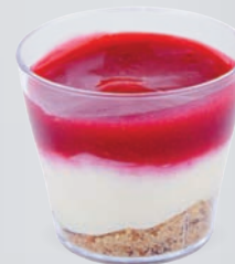
CHEESECAKE À LA FRAMBOISE

WHITE CHOCOLATE TRIO OF RASPBERRY 721132810220