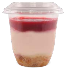
CHEESECAKE À LA FRAMBOISE