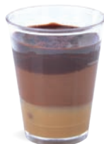
CHOCOLAT NOIR DULCE DE LECHE - GANACHE

LEMON CHEESECAKE COOKIE CRUMBLE - GUAVA 703136810220