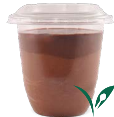
GANACHE CHOCOLAT - CHOCOLAT

CHOCOLATE GANACHE - CHOCOLATE 727138910215