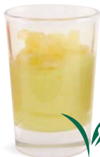
CITRON - ÉCORSE DE CITRON