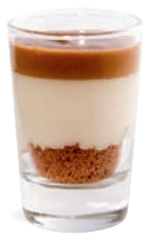
MASCARPONE - BRISURES DE SPECULOOS

MASCARPONE SPECULOOS CRUMBLE 701122510224