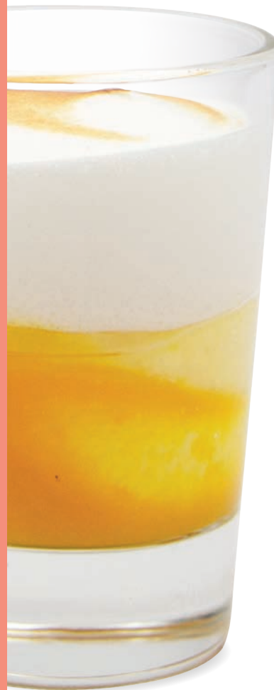
Table des matières Table of content

A new idea, a new concept, a new product? Contact us!