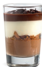
CHOCOLAT NOIR - CHOCOLAT BLANC - GANACHE

CHEESECAKE - PINEAPPLE WHITE CHOCOLATE 701131310224