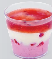
CHOCOLAT BLANC TRIO DE FRAMBOISE

WHITE CHOCOLATE TRIO OF RASPBERRY 721132810220