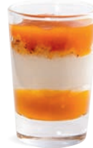
CRÉMEUX COCO COULIS DE MANGUE

VANILLA CREAM SALTED CARAMEL 701118210224