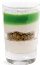
FROMAGE BLANC PISTACHE

LEMON CHEESECAKE COOKIE CRUMBLE - GUAVA 701136810224