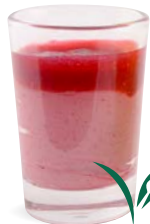
FRAMBOISE - COULIS DE FRAMBOISE

RASPBERRY - RASPBERRY COULIS 701143410224