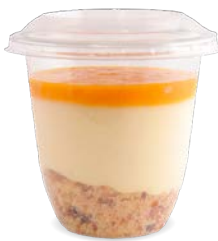
CITRON - MANGUE CRUMBLE