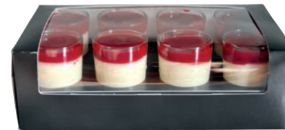
8-PACK MASCARPONE - FRAMBOISE

8-PACK DARK CHOCOLATE/WHITE CHOCOLATE - GANACHE 711118510608