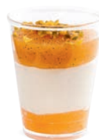
PANNA COTTA ABRICOT

CHEESECAKE WITH RASPBERRIES 703124610220