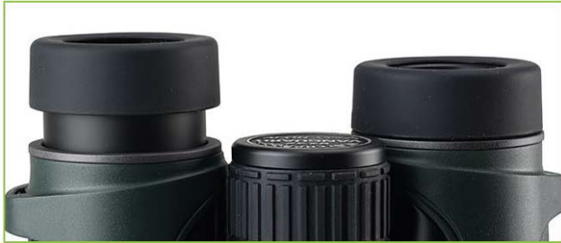
3段階のツイストアイカップ