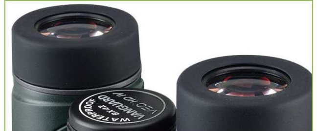
大きな接眼レンズ