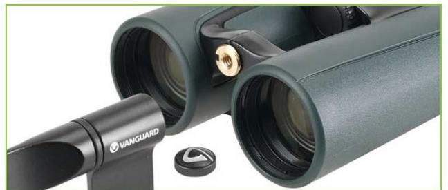
三脚に取り付け可能 (別売りアダプター使用)