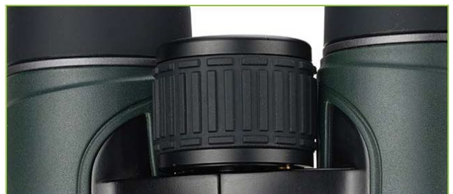
大型のフォーカスホイール