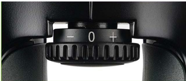
センターロック視度調整