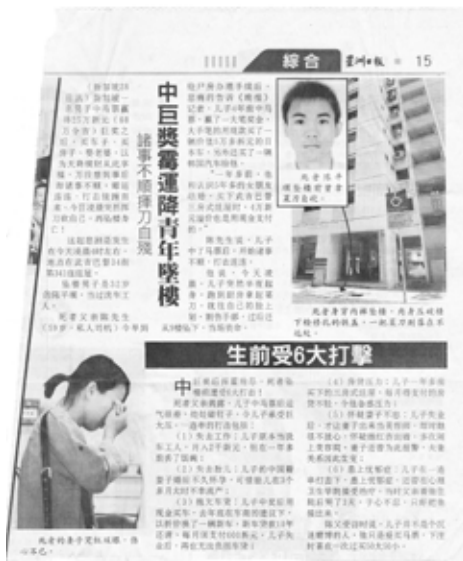
图 (4) : 28/3/2010