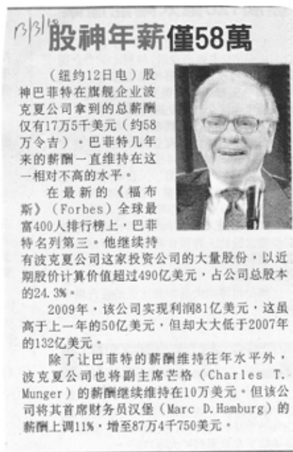
图(5): 13/3/2010