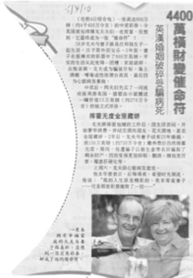
图 (3) : 5/4/2010, 星洲日报