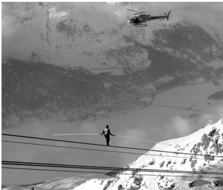
图（1）：Freddy Nock在瑞士雪山度假圣地圣莫里茨（St. Moritz）的高空钢索表演

期货市场是一个高风险、高回酬的地方，我们能轻易赚到4位数或别人一年的工资；不过，我们也可能在一瞬间就把几年的储蓄，在一个月里边给输掉！所以，资金管理是期货投机里，最重要的一课。有鉴于此，我不会把自己所有的资金全放进去，我会把资金分成几个部份，然后分批投进去。不过，如果一开始，我做对了（就会有利润），我通常都不会再另外把钱汇入我的期货户口。反之， 我会用赚来的钱，再去赚钱。 这样的方法，坦白来说，会拖慢我赚钱的速度；不过， 我认为对于高风险的投资，我们就要保持谨慎，就如走钢索般，应步步为营，才是保命的好办法。