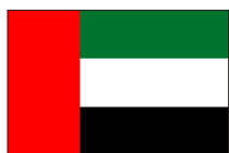
阿拉伯联合酋长国