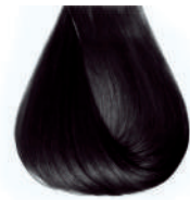
nero Black • Negro • Noir • Schwarz • Preto • Черный ΜΑΥΟ • أسود