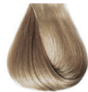
biondo chiarissimo cenere Ash very light blond • Rubio clarissimo ceniza Blond très clair cendre • Hell Hellblond Kalt Louro clarissimo cinza Блондин очень светлый пепельный ΣΑΜΒΟ ΠΟΛΥ ΑΝΟΙΚΤΟ ΕΝΤΟΝΟ ΣΑΝΤΡΕ • انظر فاتح جدا رمادي كثيف