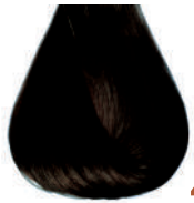
castano naturale intenso Intensive natural brown Castano natural intensive • Châtain naturel intensive Naturbraun intensiv • Castanho natural intensive Каштановый натуральный интенсивный ΚΑΣΤΑΝΟ ΦΥΣΙΚΟ ΕΝΤΟΝΟ • كستاني طبيعي كثيف