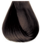
biondo scuro intenso Intensive dark blond • Rubio oscuro intensivo Blond foncé intensivo • Dunkelblond Intensiv Louro escuro intensivo Блондин темный интенсивный ΣΑΜΒΟ ΣΚΟΥΡΟ ΕΝΤΟΝΟ • انظر غامق كثيف