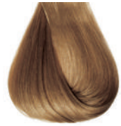
biondo chiaro Light blond • Rubio claro • Blond clair • Hellblond Louro claro • Блондин светлый • ΣΑΜΒΟ ΑΝΟΙΚΤΟ انظر فاتح