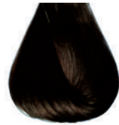
castano chiaro intenso Intensive light brown • Castano claro intensivo Châtain clair intensive • Hellbraun Intensiv Castanho claro intensivo Каштановый светлый интенсивный ΚΑΣΤΑΝΟ ΑΝΟΙΚΤΟ ΕΝΤΟΝΟ • كستاني فاتح كثيف