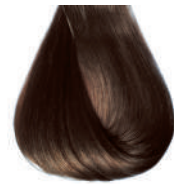
castano chiaro Light brown • Castano claro • Châtain clair • Hellbraun Castanho claro • Каштановый светлый ΚΑΣΤΑΝΟ ΑΝΟΙΚΤΟ • كستاني فاتح