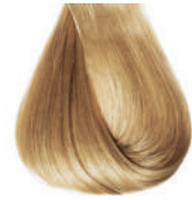
biondo chiarissimo Very light blond • Rubio clarissimo • Blond très clair Hell hellblond • Louro clarissimo Блондин очень светлый • ΣΑΜΒΟ ΠΟΛΥ ΑΝΟΙΚΤΟ انظر فاتح جدا