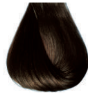
castano naturale Natural brown • Castano natural • Châtain naturel Mittelbraun • Castanho natural Каштановый натуральный • ΚΑΣΤΑΝΟ • كستاني طبيعي