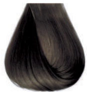
biondo scuro cenere Ash dark blond • Rubio oscuro ceniza Blond foncé cendre • Dunkelblond Kalt Louro escuro cinza • Блондин темно-пепельный ΣΑΜΒΟ ΣΚΟΥΡΟ ΕΝΤΟΝΟ ΣΑΝΤΡΕ • انظر غامق رمادي