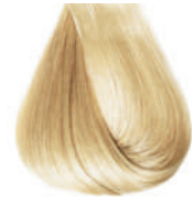
biondo platino Platinum blond • Rubio platino • Blond platine Platinblond • Louro extraclaro • Блондин платиновый ΚΑΤΑΛΑΝΟ • انظر الفاتح