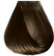
biondo scuro Dark blond • Rubio oscuro • Blond foncé • Dunkelblond Louro escuro • Блондин темный • ΣΑΜΒΟ ΣΚΟΥΡΟ • انظر غامق