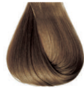
biondo chiaro intenso Intensive light blond • Rubio claro intensivo Blond clair intensivo • Hellblond Intensiv Louro clarissimo intensivo Блондин светлый интенсивный • ΣΑΜΒΟ ΑΝΟΙΚΤΟ ΕΝΤΟΝΟ انظر فاتح كثيف