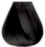
castano naturale cenere Ash natural brown • Castano natural ceniza Châtain naturel cendre • Mittelbraun Kalt Castanho natural cinza Каштановый натуральный пепельный ΚΑΣΤΑΝΟ ΕΝΤΟΝΟ ΣΑΝΤΡΕ • كستاني طبيعي رمادي