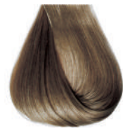
biondo chiaro cenere Ash light blond • Rubio claro ceniza Blond clair cendre • Hellblond Kalt • Louro claro cinza Блондин светло-пепельный ΣΑΜΒΟ ΑΝΟΙΚΤΟ ΕΝΤΟΝΟ ΣΑΝΤΡΕ • انظر فاتح رمادي