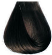
castano scuro Dark brown • Castano oscuro • Châtain foncé Dunkelbraun • Castanho escuro • Каштановый темный ΚΑΣΤΑΝΟ ΣΚΟΥΡΟ • كستاني غامق