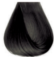
castano chiaro cenere Ash light brown • Castano claro ceniza Châtain clair cendre • Hellbraun Kalt Castanho claro cinza Каштановый светло-пепельный ΚΑΣΤΑΝΟ ΑΝΟΙΚΤΟ ΕΝΤΟΝΟ ΣΑΝΤΡΕ • كستاني فاتح رمادي