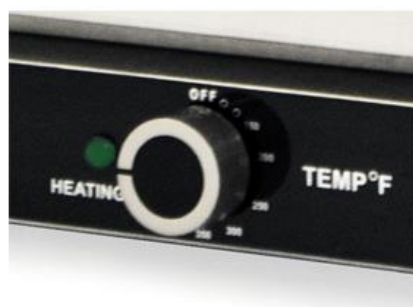
REGULADOR DE TEMPERATURA