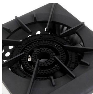
REJILLAS SUPERIORES DE HIERRO FUNDIDO