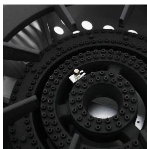
QUEMADORES HEAVY DUTY