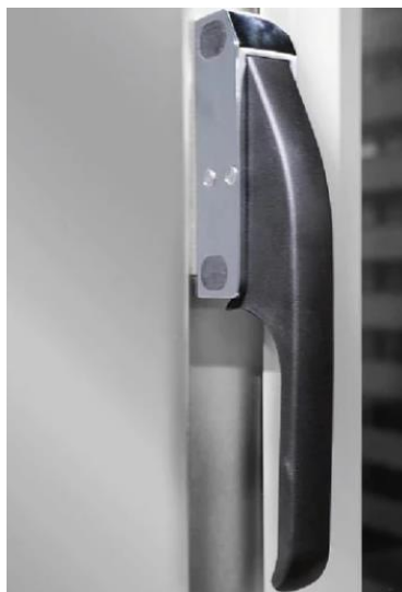
PUERTA EN POLICARBONATO