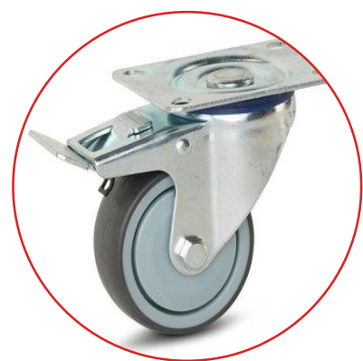
Rueda con freno