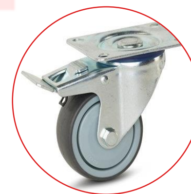
Rueda con freno