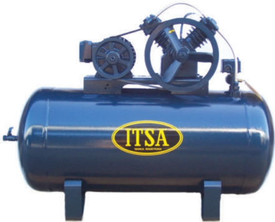
ITSA SERIE I-200 MODELO I-2116-HL

DE 1 A 40 H.P. DE 5 A 162 P.C.M. PRESIONES HASTA 250 L.P.C COMPRESORES DE AIRE PARA TRABAJO PESADO