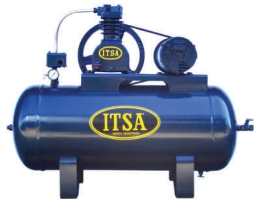
ITSA SERIE I-100 MODELO I-153-HL