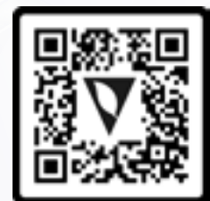
Dein Link zum Produkt