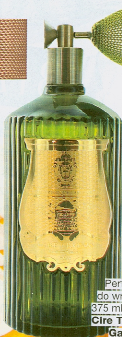
Perfumy do wnętrza, 375 ml/630 zł, Cire Trudon/ Gailiu