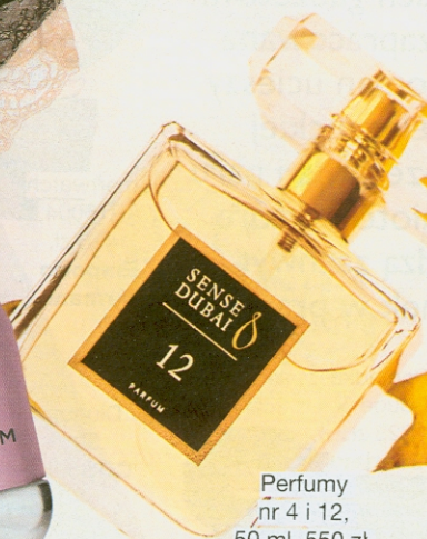
Perfumy nr 4 i 12, 50 ml, 550 zł, Sense Dubai