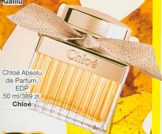
Chloé Absolu de Parfum, EDP, 50 ml/389 zł, Chloé