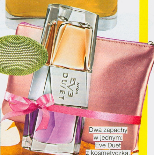
Dwa zapachy w jednym: Eve Duet z kosmetyczką, EDP, 50 ml/99,99 zł, AVON