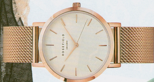
Zegarek, ok. 450 zł, Rosefield