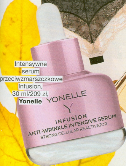
Intensywne serum przeciwmarszczkowe Infusion, 30 ml/209 zł, Yonelle