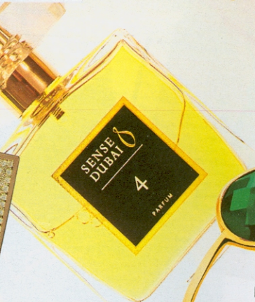
Pierścionek, 389 zł, Apart