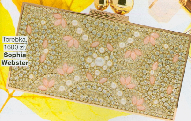
Torebka, 1600 zł, Sophia Webster