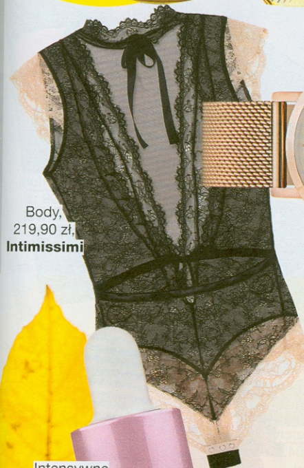
Body, 219,90 zł, Intimissimi