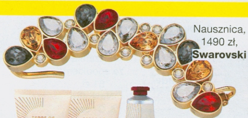
Nausznica, 1490 zł, Swarovski