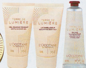
Zestaw Terre de Lumière Złota Edycja, ok. 350 zł, L'Occitane