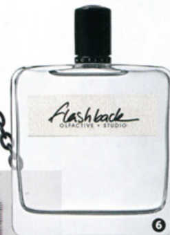
«НАЗАД В ПРОШЛОЕ», ЛОРАН СЕГРЕТЬЕ.