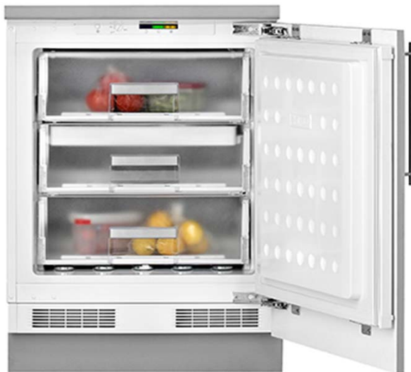
Foto referencial, producto instalado. Puertas exterior y tirador decorativo no incluidos.