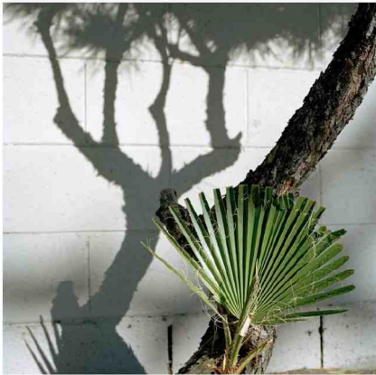
Beeld uit 'Picture summer on Kodak film' (MACK, 2020)