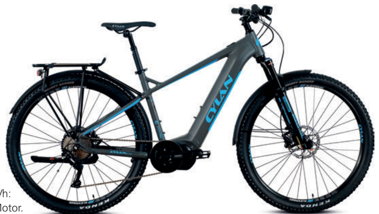
Explora MTB 30 von Cylan, 25km/h: Mit gratis Update zum stärksten Shimano-Motor.

Der Kauf eines neuen E-Bikes wird durch die Digitalisierung einfacher, schneller, bequemer. In Online-Shops können Interessierte neue E-Bikes rund um die Uhr bestellen. Das ist heute schon gang und gäbe.