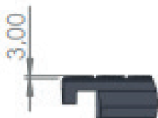
DÉTAIL H ECHELLE 1 : 5