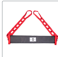
Sling met glijstuk