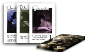
9 קלפי תפקיד