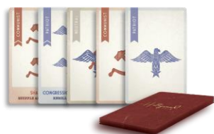
60 קלפי תעמולה