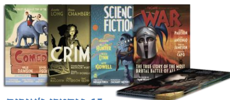
15 פוסטרי ז'אנרים