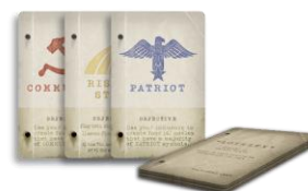
9 קלפי שיוך