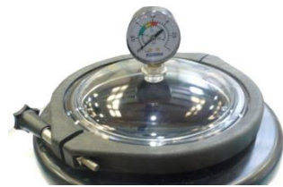
▪ Transparent top lid with V-clamp system ▪ Tapa superior transparente con cierre zuncho